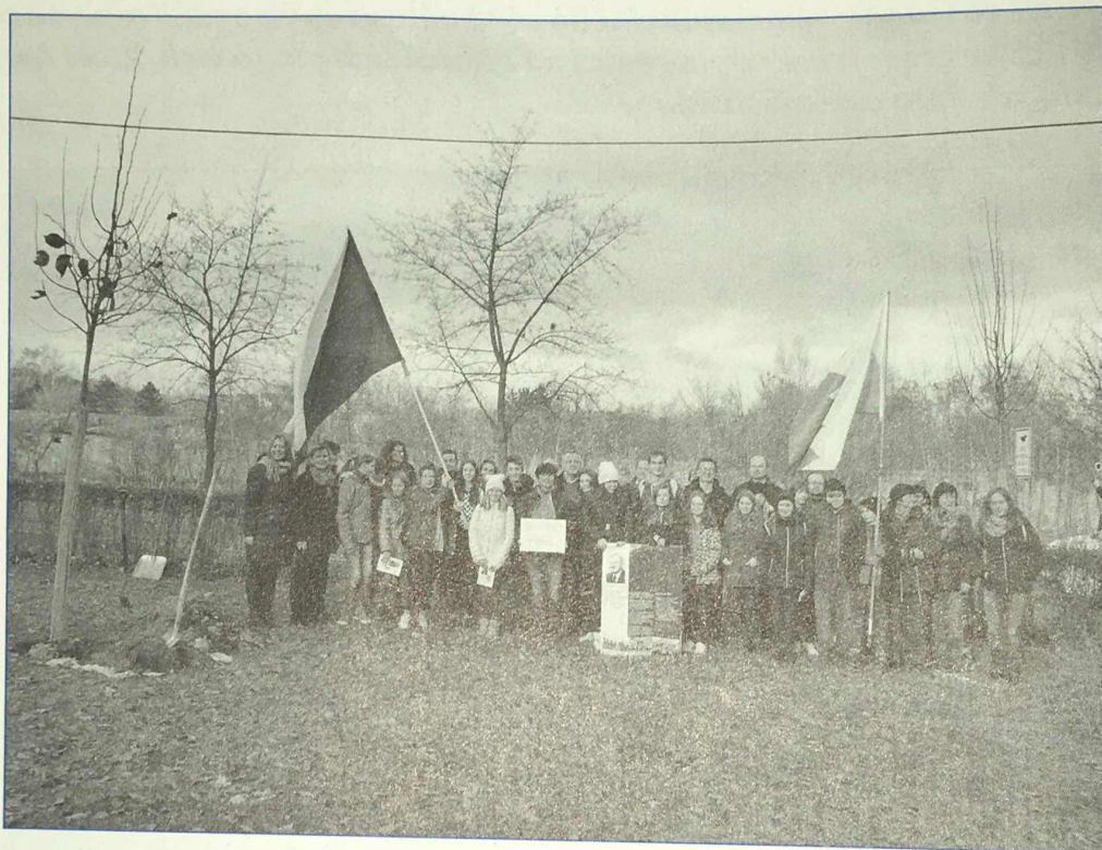
V rámci projektu byla také zasazena lípa, symbol české státnosti, pro kterou pan Sucharda položil život.

„Dnešní akce se nám moc líbila, měli jste to krásně zorganizované a pro nás je důležitou vzpomínkou. Dědečka jsme si bohužel neuzily, narodily jsme se až po jeho smrti. Jsme rády, že si dědečka díky této slavnosti můžeme připomenout a uchovat si hezkou vzpomínku.“